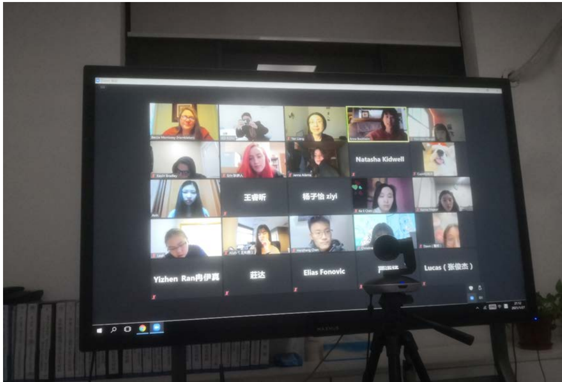
第二期“远程国际伙伴语言交流学习活动”